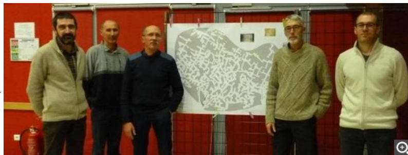
Le bureau et les spéléos devant la carte squelette.